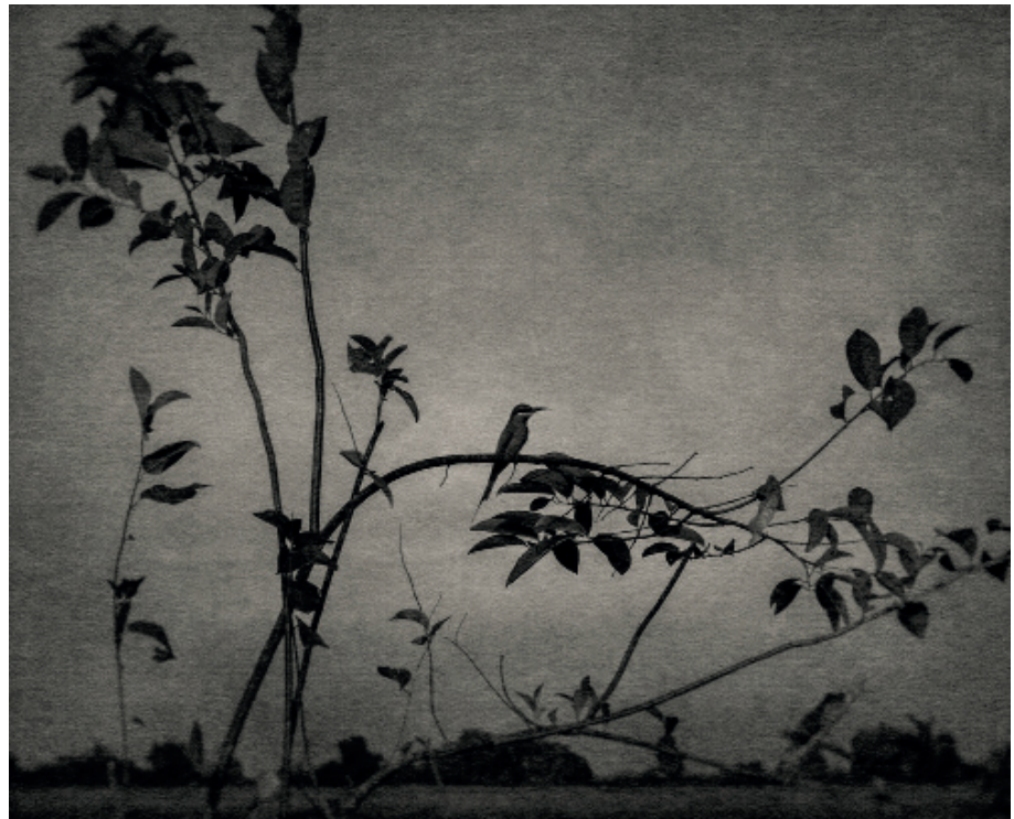
Petite figure décorative sur fond ornemental Tirage argentique à l'agrandisseur réalisé par l'artiste, teinté au thé et ciré 45 x 55 cm, éd. 4/7