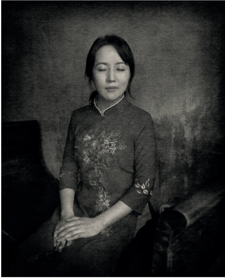
Chère amie Tirage pigmentaire sur Gampi sur feuille d'or 24 carats 24 x 30 cm, éd. 4/5