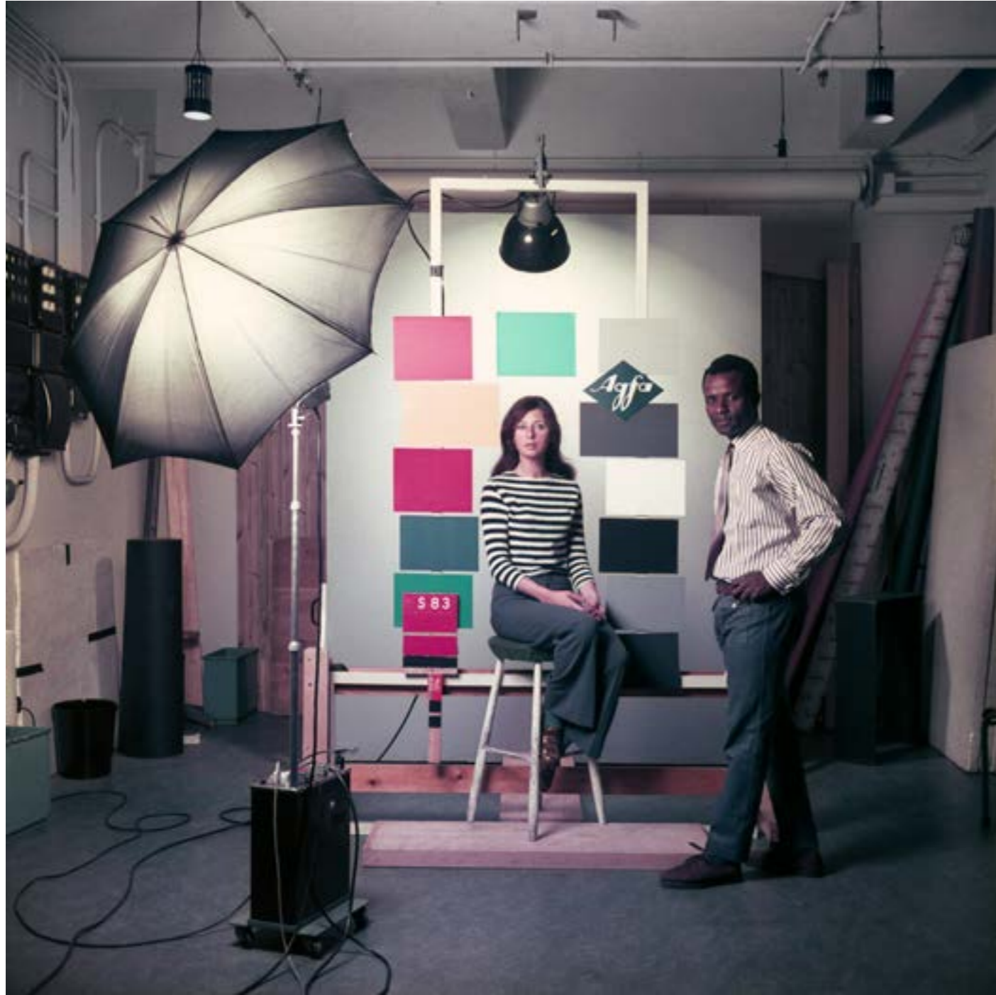
James Barnor at the special Agfa-Gevaert studio, Mortsel, Belgium, 1969 Tirage Cibachrome / Cibachrome print 24 x 30 cm Ed. 3/5

GALERIE CLÉMENTINE DE LA FÉRONNIÈRE 51, rue saint-Louis-en-l'île - Paris 75004 Tél. : 01 42 38 88 85 / 06 50 06 98 68 www.galerieclémentinedelaferonniere.fr mail@galerieclémentinedelaferonniere.fr Ouvert du mardi au samedi de 11 h à 19 h