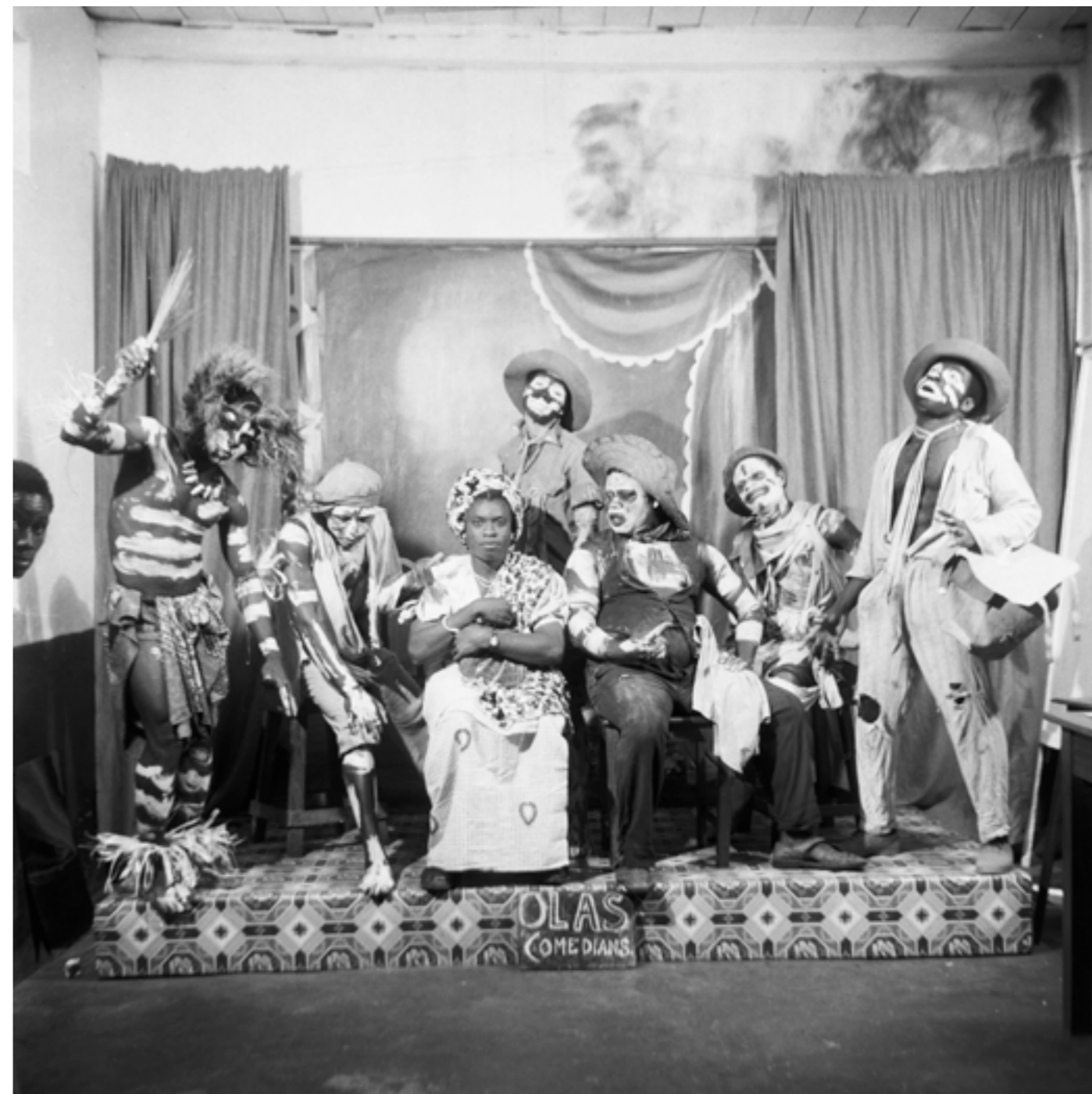
The Olas Comedians, an all-male troupe of actors, Ever Young studio, Accra, c. 1953-1954 Tirage argentique / Gelatin silverprint 24 x 30 cm Ed. 2/5