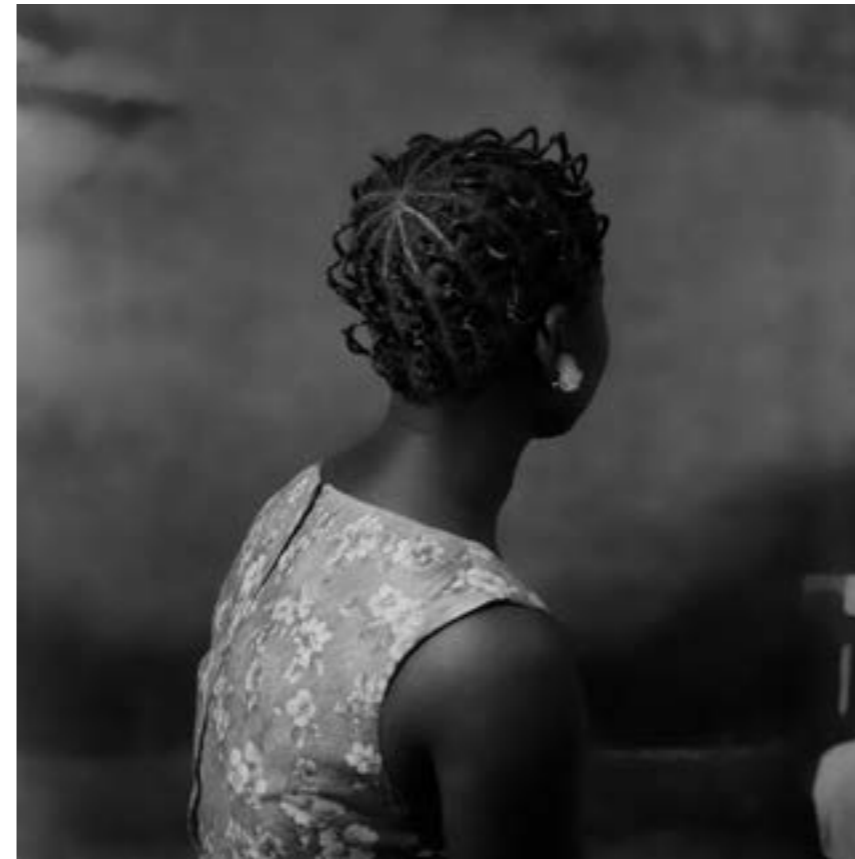
Ever Young studio, Accra, c.1953-1954 Tirage argentique / Gelatin silverprint 24 x 30 cm Ed. 3/5