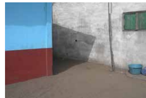
Sans titre (Port-Bouët, Abidjan)

Artiste français né en 1979, Adrien Boyer vit à Paris. Autodidacte, son travail est exposé pour la première fois en 2009.