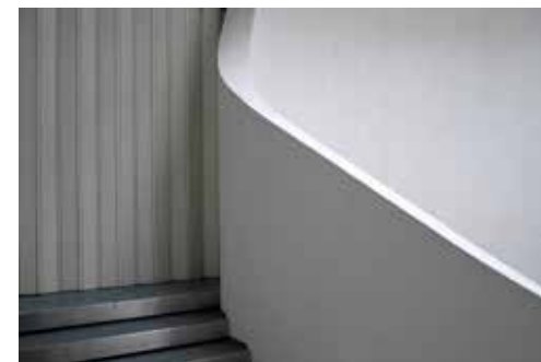
Sans titre (Fregene, Italie), n°1