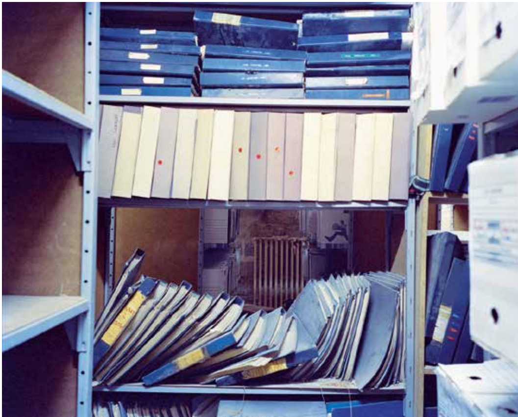
Tribunal judiciaire d'Arras, archives

Vente aux enchères des biens saisis à l'occasion de procédures pénales par l'Agence de gestion et de recouvrement des avoirs saisis et confisqués.