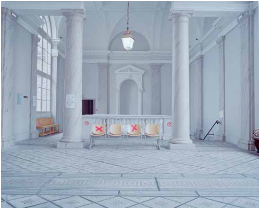
Tribunal judiciaire de Boulogne-sur-Mer, salle des pas perdus