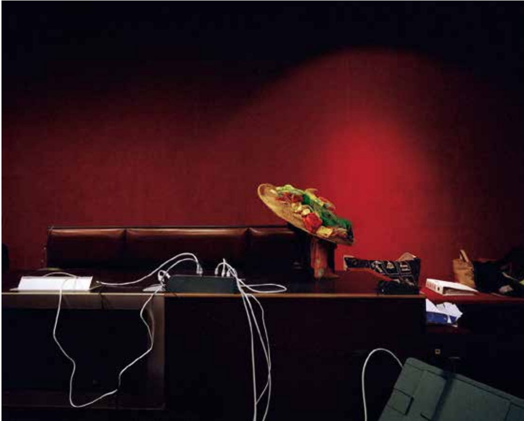
Paris, hôtel des ventes de Drouot

Vente aux enchères des biens saisis à l'occasion de procédures pénales par l'Agence de gestion et de recouvrement des avoirs saisis et confisqués.